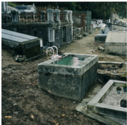
... Du haut, de l'eau, de là

Et toujours à Paris, visitable 24h/24h à l' Autre Rive :